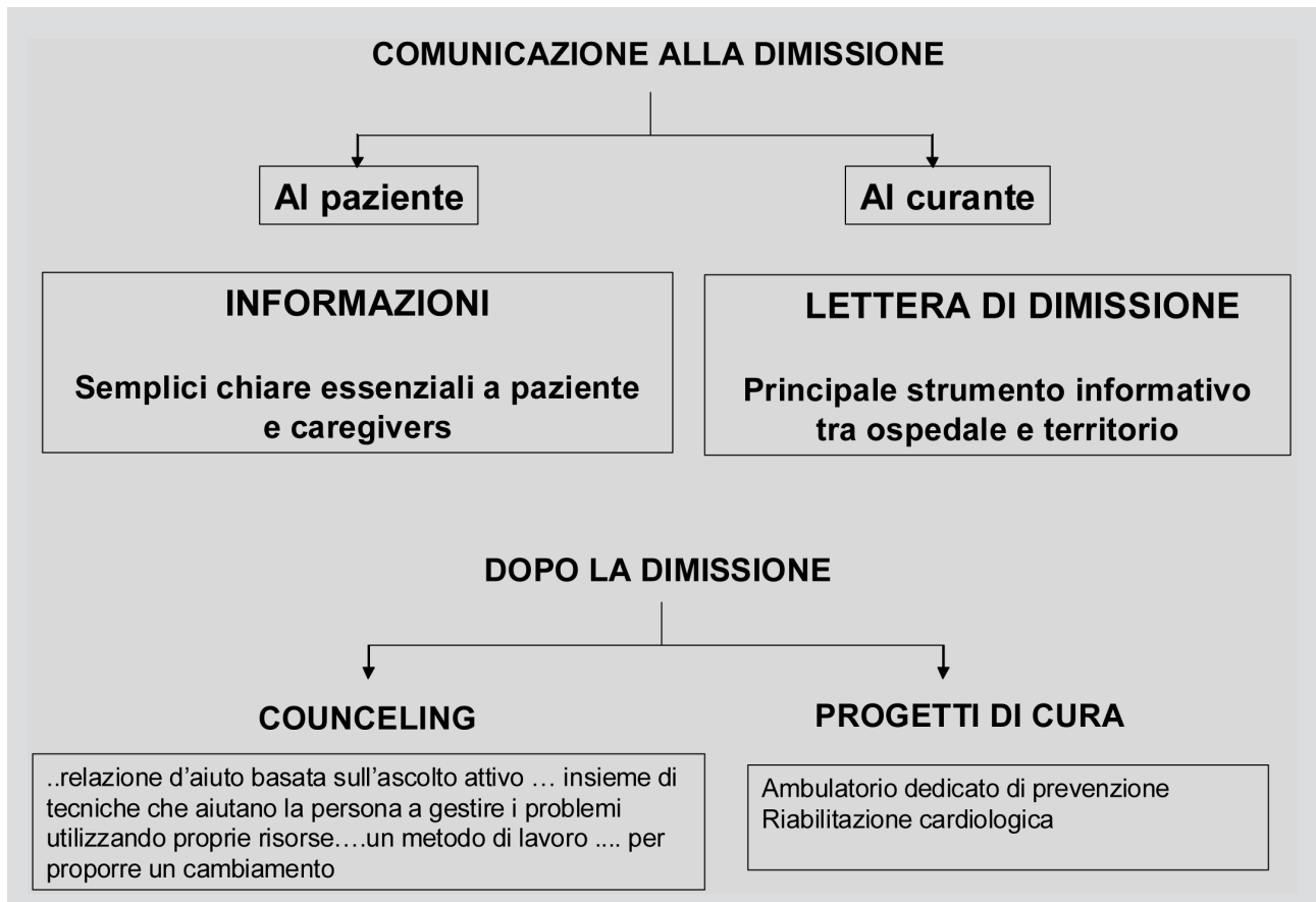
Figura 1. - Aspetti della comunicazione ospedaliera.

Lettera di dimissione - È il mezzo di trasferimento delle notizie sul ricovero dal medico ospedaliero al medico curante e risulta quindi il principale, se non unico, strumento informativo tra ospedale e territorio. La chiarezza e completezza dei contenuti, fondamentali per un corretto "handoff", sono necessari per la prevenzione del rischio di nuovi eventi in