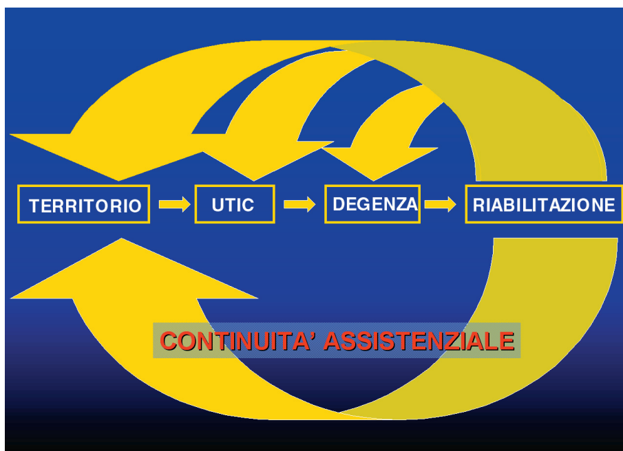
Figura 2. - La continuità assistenziale ospedale-territorio.

[9] e rappresenta una componente importante per un programma assistenziale a lungo termine [10]. La riabilitazione è importante perché fa prevenzione secondaria, stratificazione prognostica, follow-up clinico e strumentale e ottimizza la terapia, assicurando in questo modo non solo un prolungamento della quantità della vita, ma soprattutto una migliore qualità [11-12].