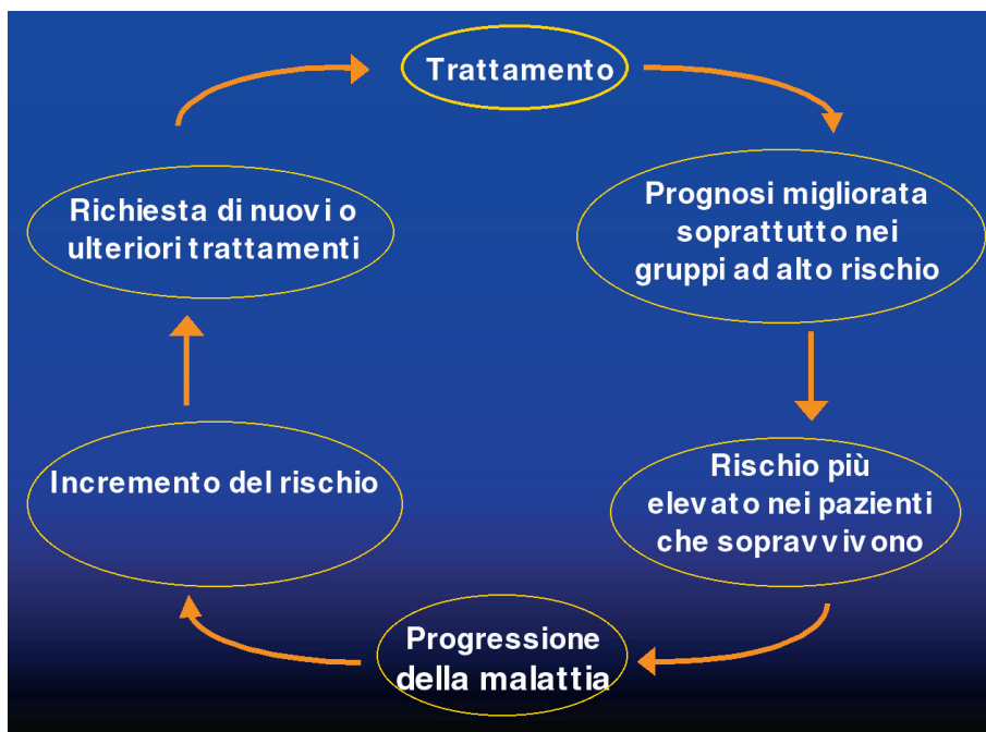
Figura 1. - La spirale del rischio.