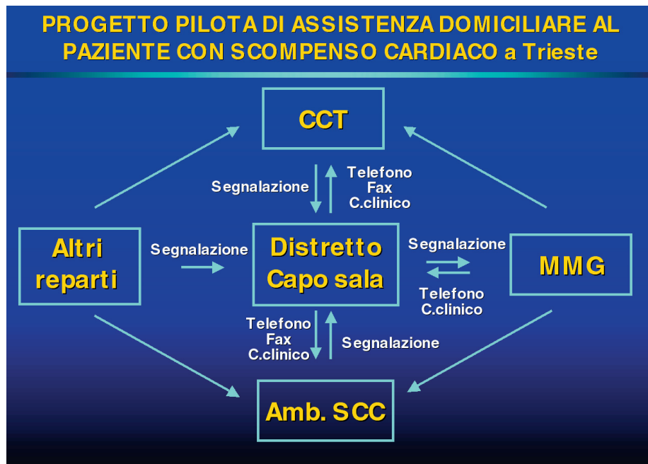
Figura 4. - I collegamenti nel progetto Trieste Heart Failure.