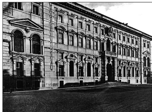
Pavia - Almo Collegio Borromeo